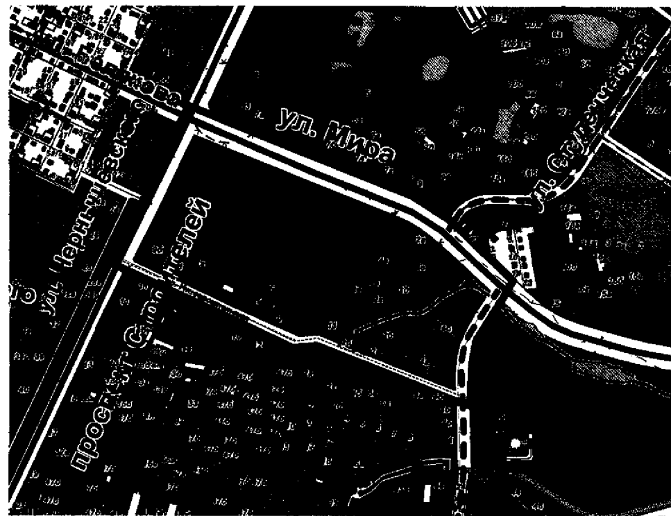
СХЕМА границ территории проектирования

Приложение № 1 к постановлению администрации города Владимира от 16.05.2019 № 1256