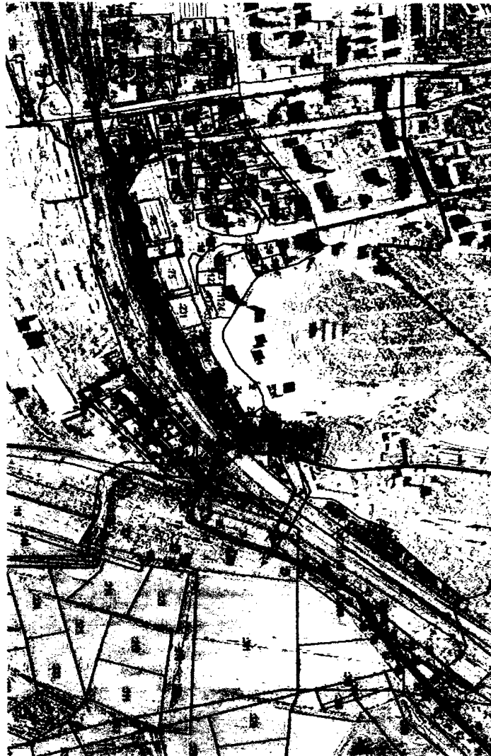
Схема расположения границ публичного сервитута Публичный сервитут в целях размещения сооружений водоотводных сетей (определенное 05/01/21)