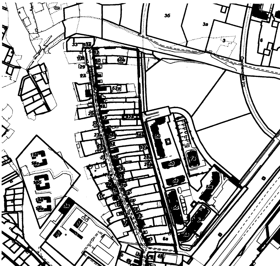
СХЕМА границ территории для проведения общественных обсуждений

Приложение к постановлению главы города от 21.06.2021 № 26