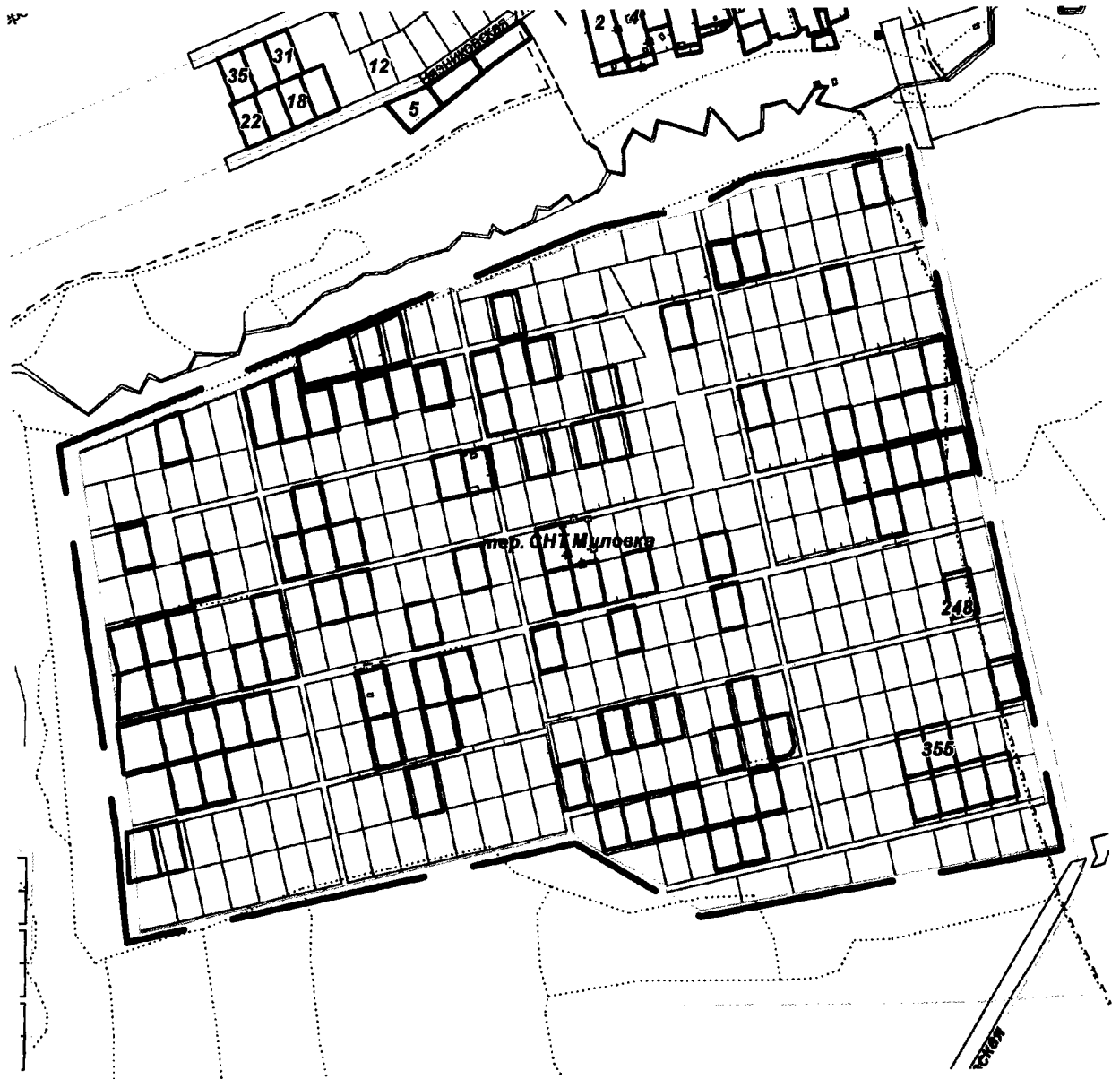
СХЕМА границ территории для проведения общественных обсуждений

Приложение к постановлению главы города от 12.04.2024 № 18