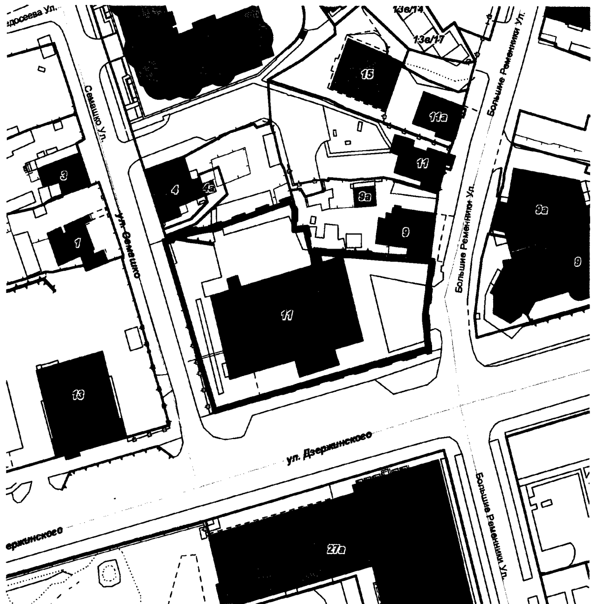
СХЕМА границ территории для проведения общественных обсуждений

Приложение к постановлению главы города от 11.04.2024 № 23