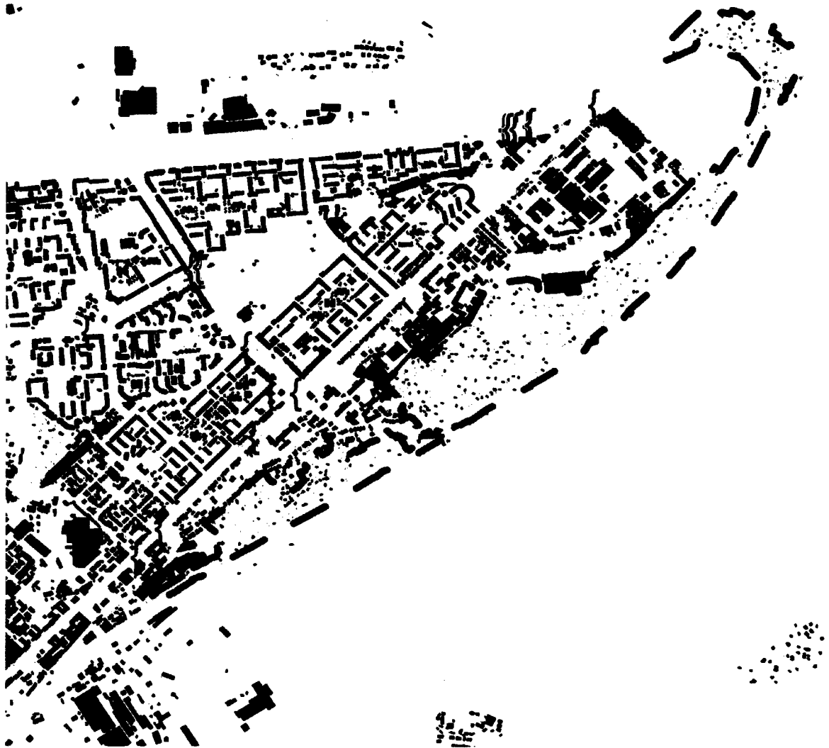
СХЕМА границ территории для проведения общественных обсуждений

Приложение к постановлению главы города от 11.06.2024 № 31