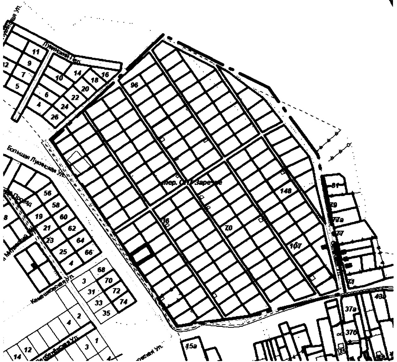
СХЕМА границ территории для проведения общественных обсуждений

Приложение к постановлению главы города от 25.06.2024 № 36