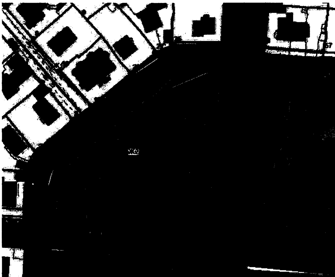
СХЕМА территории для проведения общественных обсуждений

Приложение к постановлению главы города от 29.08.2024 № 46