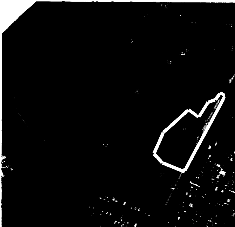
СХЕМА границ территории проектирования

Приложение № 1 к постановлению администрации города Владимира от 02.11.2024 № 2459