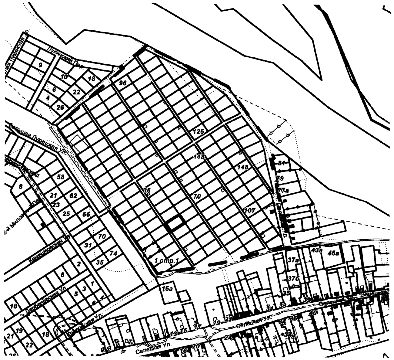
СХЕМА границ территории для проведения общественных обсуждений

Приложение к постановлению главы города от 10.12.2024 № 75