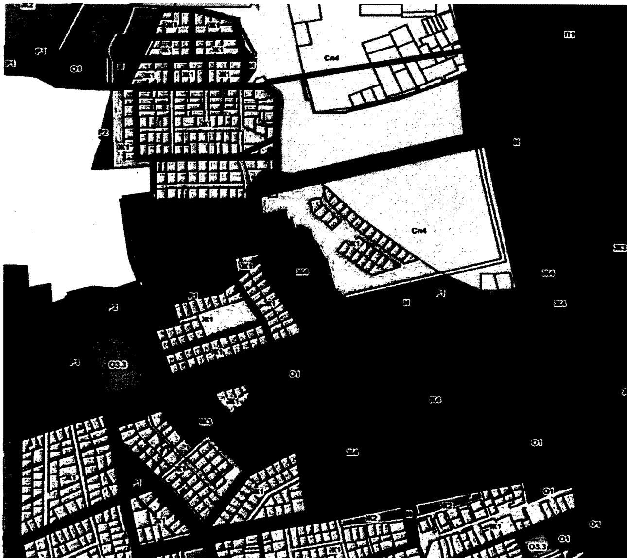
СХЕМА границ территории проектирования

Приложение № 1 к постановлению администрации города Владимира от 27.12.2024 № 3047