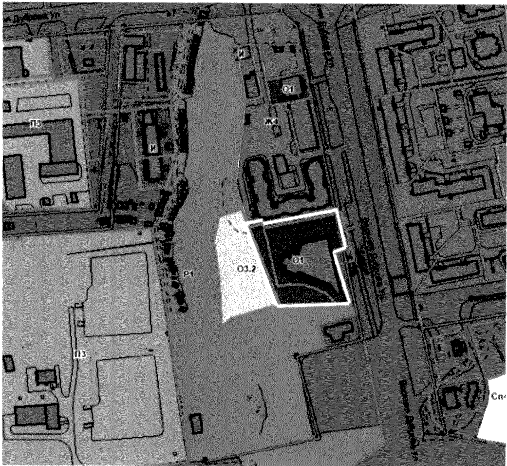
СХЕМА границ территории проектирования

Приложение № 1 к приказу начальника управления архитектуры и строительства администрации города Владимира от 26.08.2025 № 228-11